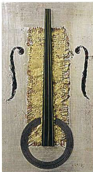
Da sinistra, Still life with glass and fruit, Pablo Picasso, 1939, olio su tela, in mostra a Perugia. Composizione n. 3, 2008, Domenica Regazzoni, collage polimerico, 40x25x1,8 cm, a Bologna.

la San Carlo Borromeo, tel. 02/994741. Cena: 65 euro.